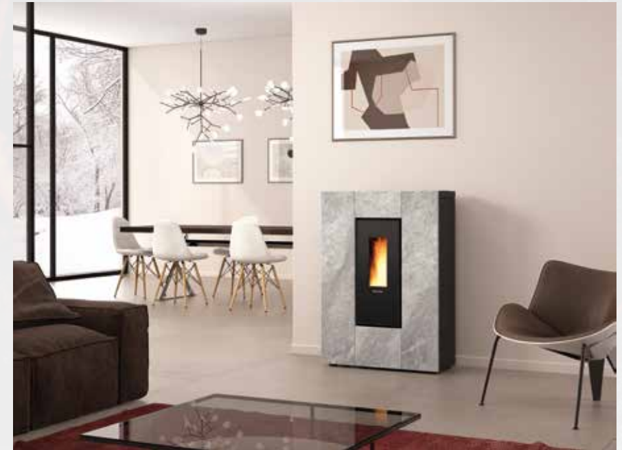
PELLETÖFEN - LEISTUNGSSTARK UND KOMFORTABEL