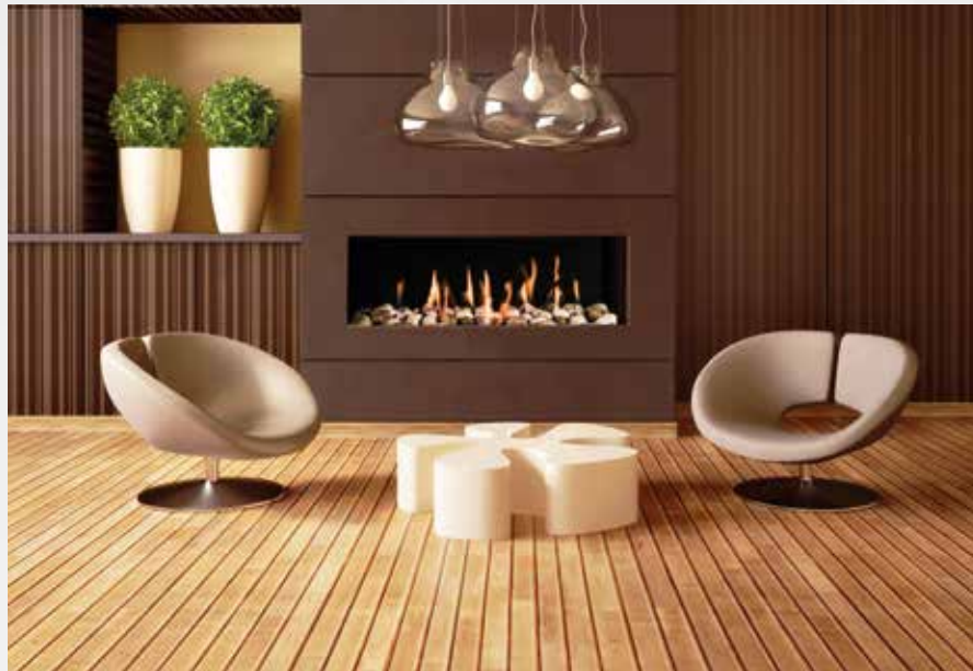
FLAMME AUF KNOPFDRECK - GASKAMINE UND GASKAMINÖFEN