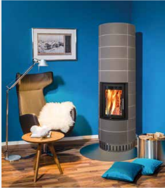
SKANDINAVISCHES KACHELÖFEN - NORDISCHES FEUER VOLLER BEHAGLICHKEIT