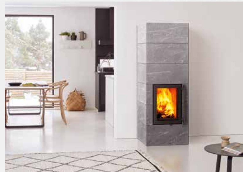
SPECKSTEIN - DAS WÄRMEWUNDER AUS DER NATUR