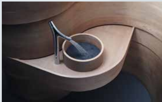
BESONDERE STILE UND LOOKS

SANITÄR-HIGHLIGHTS: Wannen, Duschen, Waschbecken, Toiletten