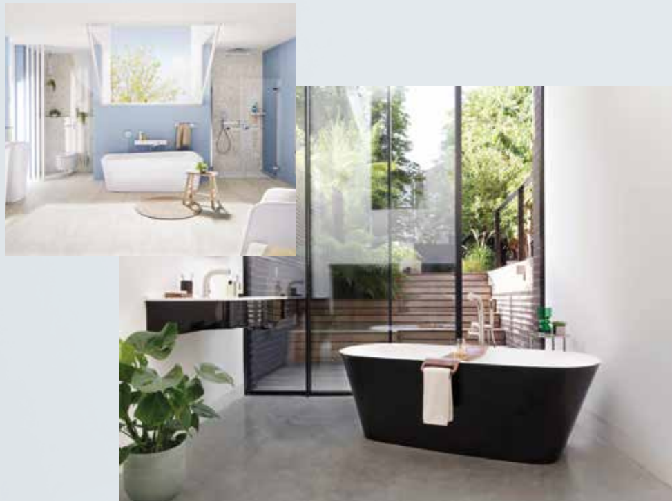
BADWELTEN: Die neuen Badezimmer Trends

AUSGABE 2021 – Vorgesehener EVT: 10.09.2021